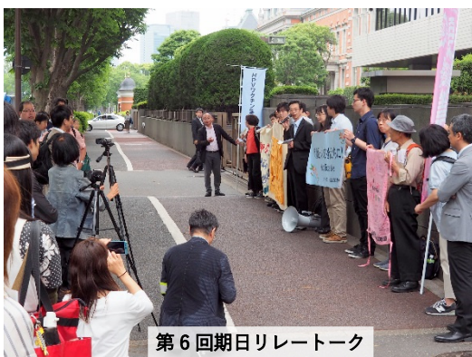
第6回期日リレートーク

https://www.hpv-yakugai.net/2018/05/30/tokyo/